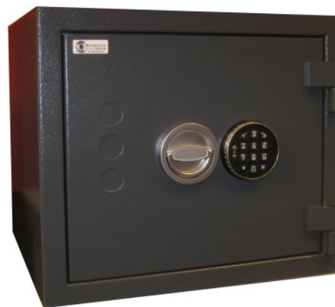
Gemini Pro 1graphit-grau