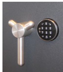
Angebotspreis mit Elektronikschloss Lagard 39E