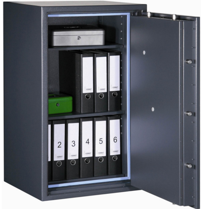
PaperStar PRO 3

VdS-Widerstandsgrad I Nach DIN 2450 und EN 1143-1. d.h. Versicherungsschutz: gewerblich bis € 20.000 privat bis € 65.000